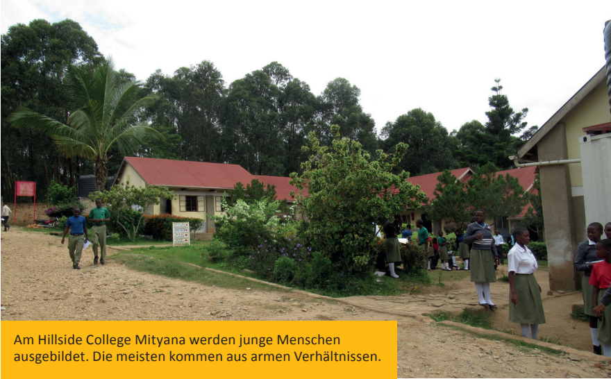
Am Hillside College Mityana werden junge Menschen ausgebildet. Die meisten kommen aus armen Verhältnissen.