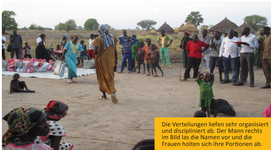
Die Verteilungen liefen sehr organisiert und diszipliniert ab. Der Mann rechts im Bild las die Namen vor und die Frauen holten sich ihre Portionen ab.