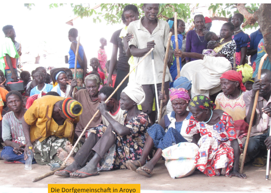
Die Dorfgemeinschaft in Aroyo

Die Menschen haben etwas Hoffnung geschöpft. Für die besuchten Dorfgemeinschaften war es das erste Mal, das jemand von außerhalb nach ihnen geschaut und sich für ihre Probleme interessiert hat. An diese Hoffnung sollten wir anknüpfen und weiter für die Leute in diesem vergessenen Land da sein. ga