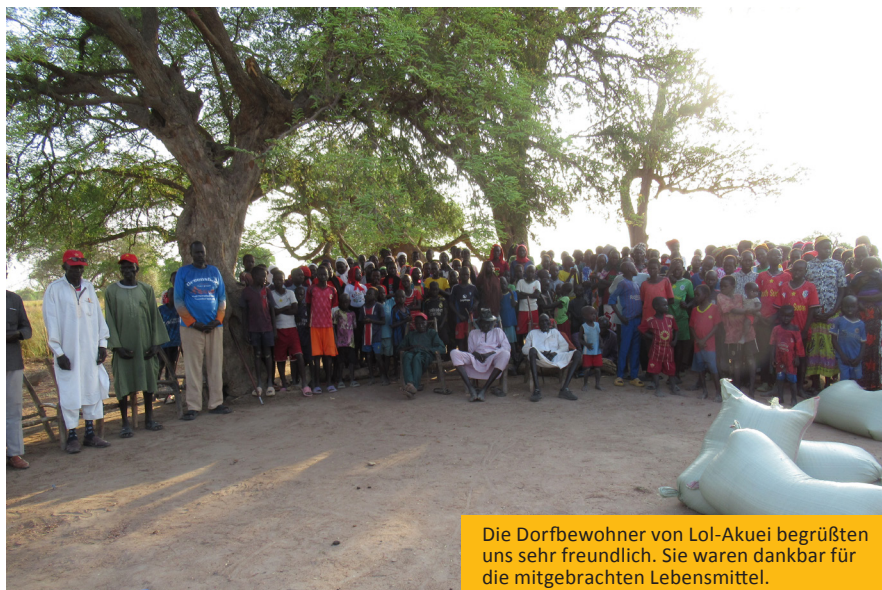
Die Dorfbewohner von Lol-Akuei begrüßten uns sehr freundlich. Sie waren dankbar für die mitgebrachten Lebensmittel.