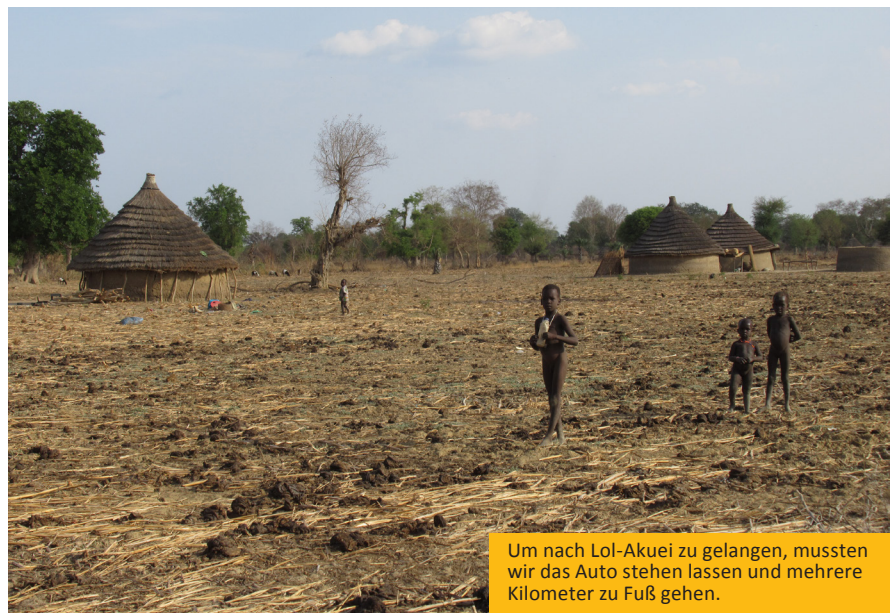
Um nach Lol-Akuei zu gelangen, mussten wir das Auto stehen lassen und mehrere Kilometer zu Fuß gehen.

Aufgrund der oben genannten Punkte hat Gott durch euch auf den Schrei geantwortet, und ihr habt in der Tat Glauben bewiesen für die Hilfe, die ihr unseren Leuten