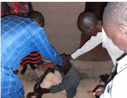
Am Tag unserer Abreise besuchte das Team das Dorf Pamat. Dort beteten sie für einen offensichtlich besessenen Mann. Nach sieben Jahren angekettet unter einem Baum, kann er jetzt wieder normal sprechen und alleine gehen.