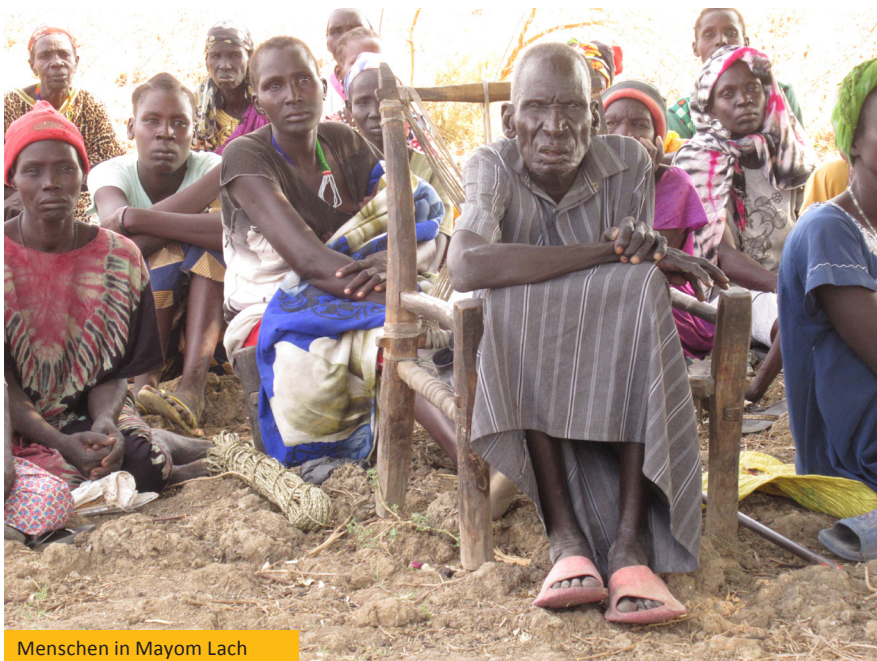
Menschen in Mayom Lach

Ihre Reaktion war sehr positiv, weshalb sie vorschlugen, die Lebensmittel, die wir erhalten haben, mit denjenigen zu teilen, die nicht registriert waren, so dass jede Familie, statt zwei Säcke Mehl zu bekommen, nur einen Sack nahm, damit alle bedürftigen Familien erreicht werden konnten.