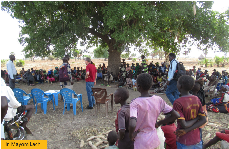
In Mayom Lach

In dem Dorf Mayom Lach erzählte man uns, dass Menschen monatelang aus Verzweiflung die Blätter von Bäumen gegessen haben. Frauen sagten, dass ihre Töchter deshalb genau so alt aussehen würden wie sie.