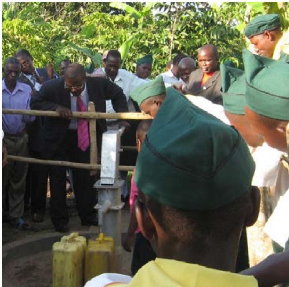
Ein Brunnen für eine Dorfgemeinschaft (Leuchtturmprojekt 2009)