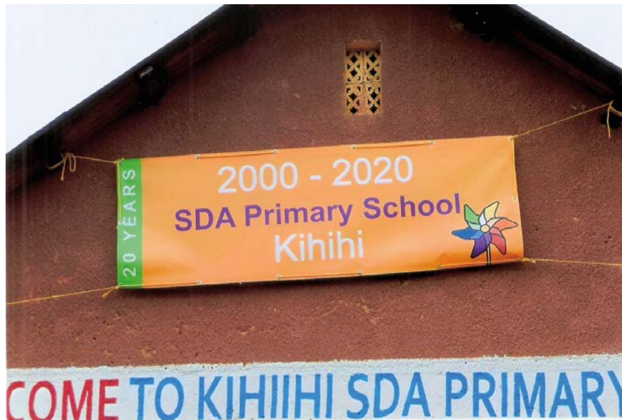
Zum 20-jährigen Bestehen der Schule gab es ein Fest.